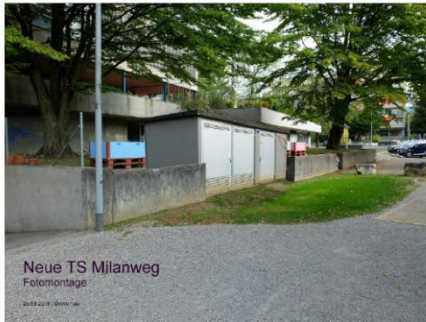
Abbildung 2 - Fotomontage Fertigstation (Distanz TS - Schulgebäude ca. 7m)