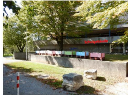
Abbildung 1 - Standort Fertigstation