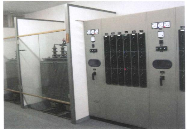
Transformatoren, 0.4kV Verteilung