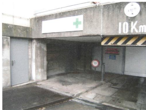
Zugang zur Transformatorenstation

80 Die Transformatorenstation Milanweg liegt im 1. Untergeschoss der Liegenschaft Lyss-Str. 19a. Diese Räumlichkeiten sind mittels Baurecht zu Gunsten der Stadt Nidau gesichert. Der Baurechtszins beträgt CHF 1388.00 pro Jahr. Der Zugang ist links in der Einfahrtsrampe zur Einstellhalle.