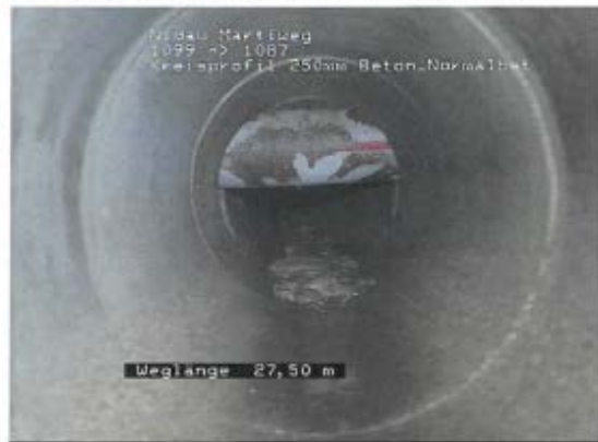
Abbildung 1: Querung durch Kanalisation

Haltung Nr. 1087 bis 1099 (bcb 4), TV-Berichte Nr. 42 + 43 Kabelschutzrohr quer durch die RWL NBR DN 250 mm