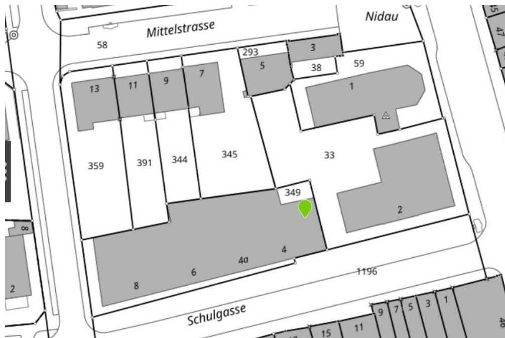
Abb.1, Situationsplan Liegenschaften Schulgasse 4 – 8, TS Zentrum