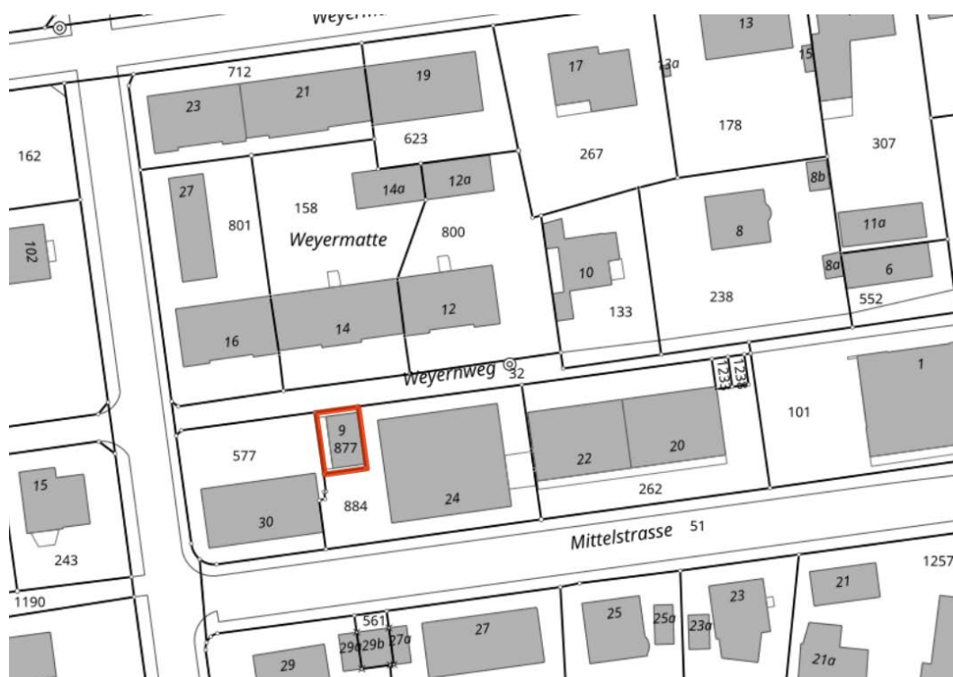
Abb. 1, Standort TS Mittelstrasse