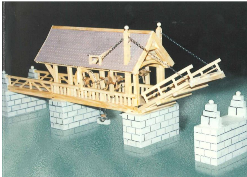
Zugbrücke beim Schloss über Zihl