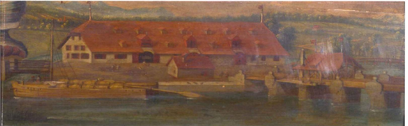
Salzhaus in Nidau, erstellt 1729/30, Ausschnitt aus einem Ölgemälde 1746/47, von Emanuel Gruber