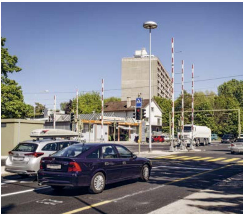
Route de Berne et Keltenstrasse avec passage à niveau: avec l'installation des feux de circulation, le croisement est équipé pour les prochaines années.

Pour de tels cas, une force d'intervention rapide («task force») sera mise en place. Dans ce groupe, représentants de la Confédération, du canton, des communes, des TP ainsi que de la police travailleront en étroite collaboration. Dès l'ouverture de la branche Est, la situation sera surveillée et ils interviendront si nécessaire. La «task force» doit rapidement faire les ajustements nécessaires à la gestion du trafic – méthode qui a notamment fait ses preuves lors de la construction du giratoire du Wankdorf à Berne.