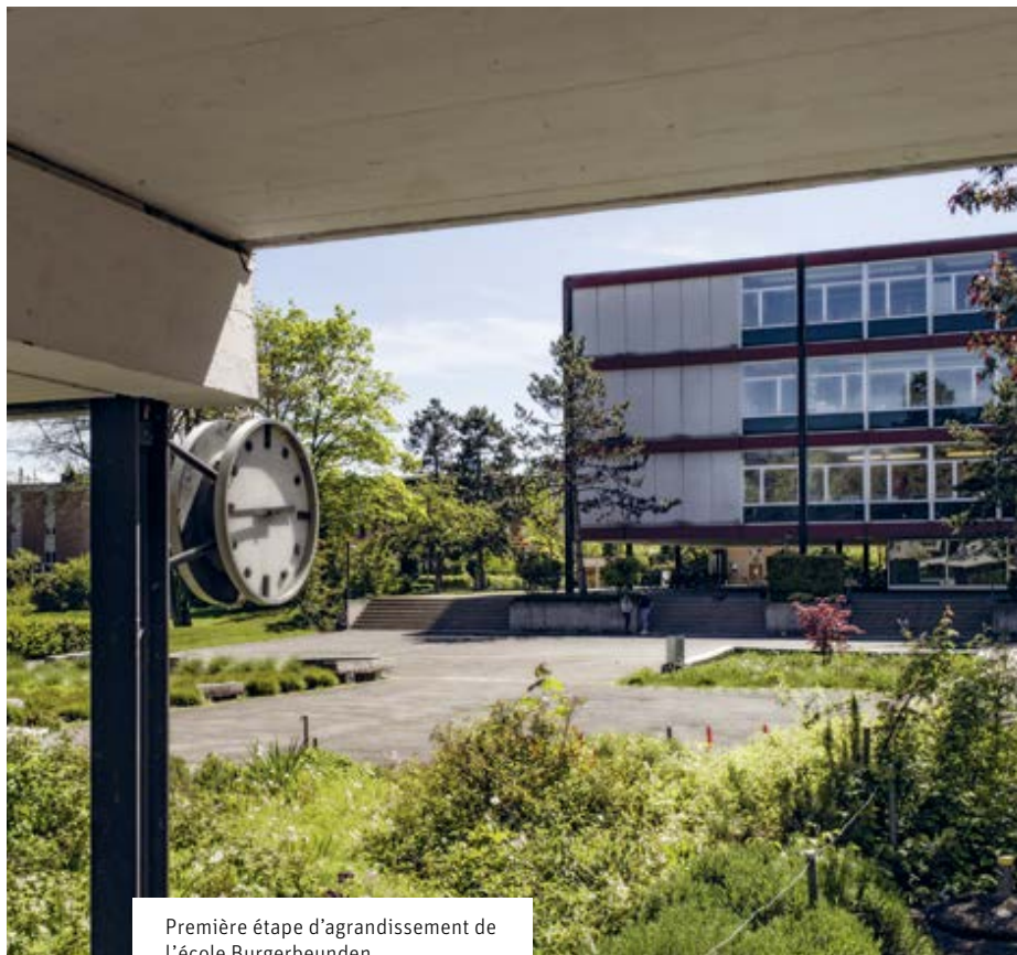
Première étape d'agrandissement de l'école Burgerbeunden.

En prenant en considération cette incertitude tout comme d'autres, il paraît donc conseillé d'agir pas après pas dans la planification des locaux scolaires et d'analyser la situation en continu.