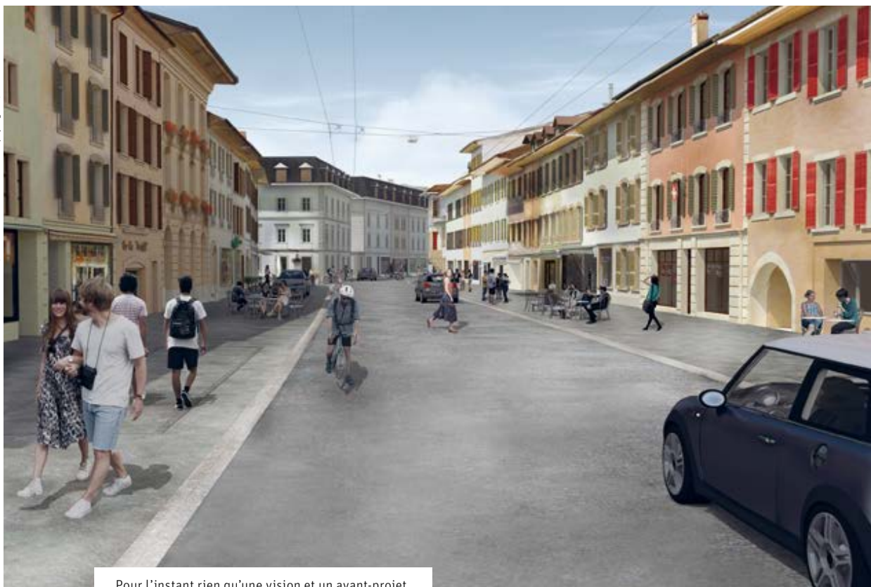
Pour l'instant rien qu'une vision et un avant-projet.

Roduner BSB + Partner AG / Maurus Schifferli, architecte paysagiste / Schär Buri architectes