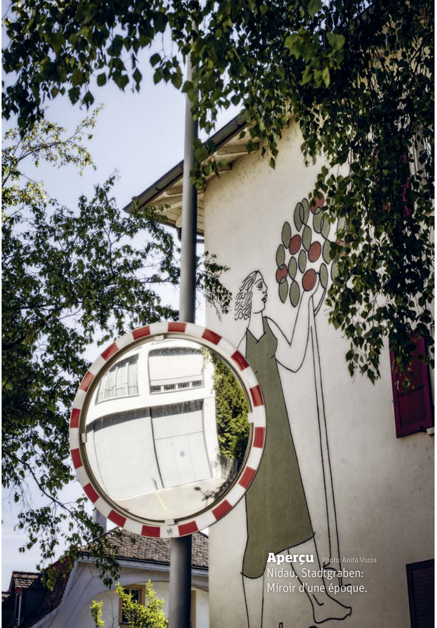
Aperçu Nidau, Stadtgraben: Miroir d'une époque.