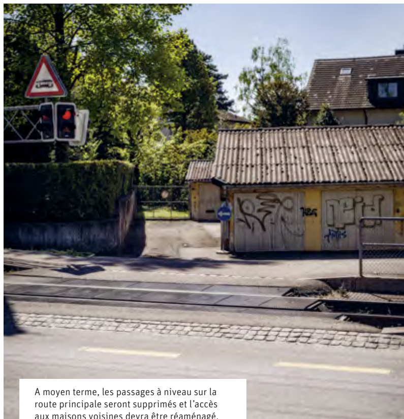
A moyen terme, les passages à niveau sur la route principale seront supprimés et l'accès aux maisons voisines devra être réaménagé.